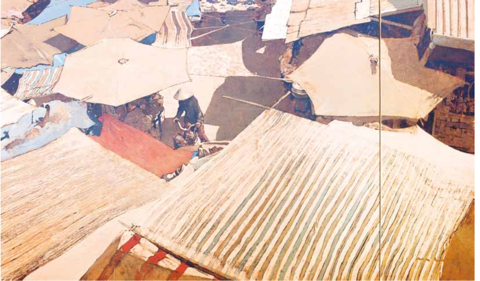
Déu de la pluja - 97x166 cm - HST