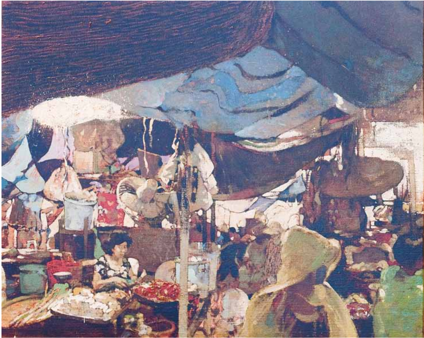
Ous amb un milió d'anys - 65x173 cm - HST