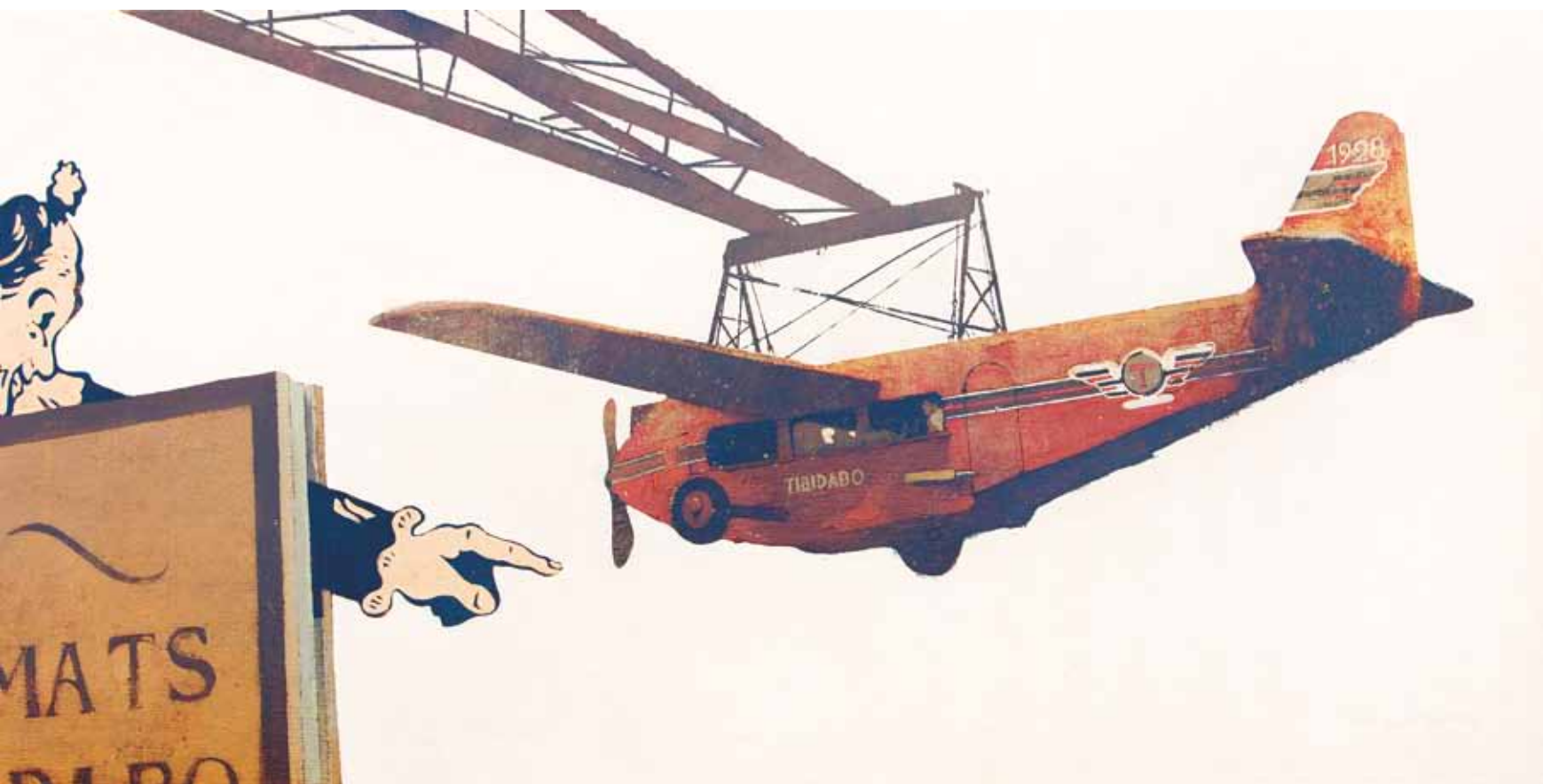
Autòmats - 65x130 cm - HST