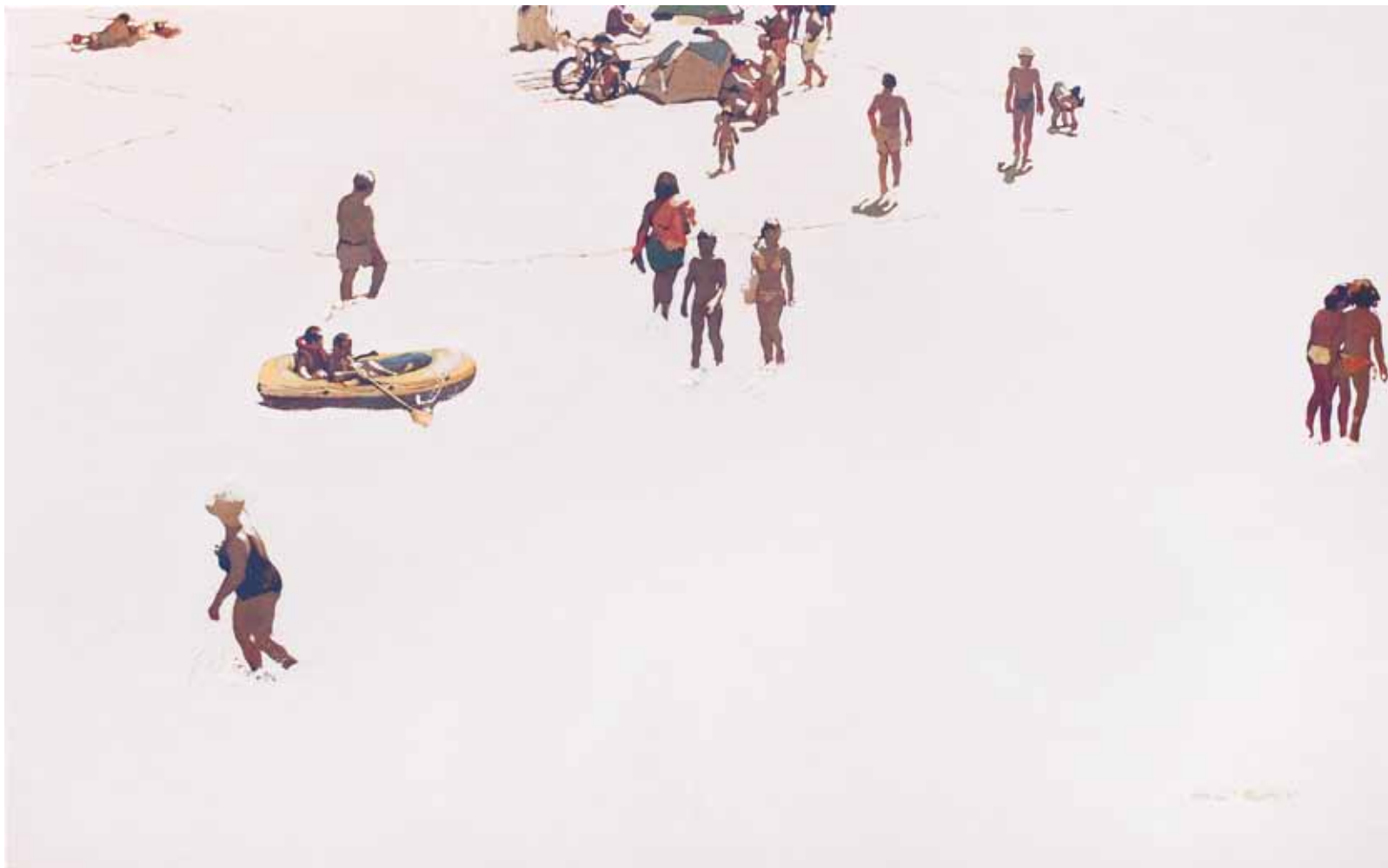
Avís per a navegants - 81x130 cm - HST