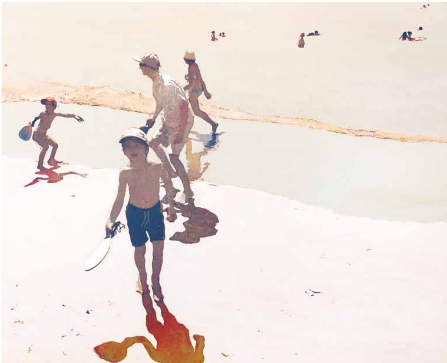
Retrat de família - 130x162 cm - HST