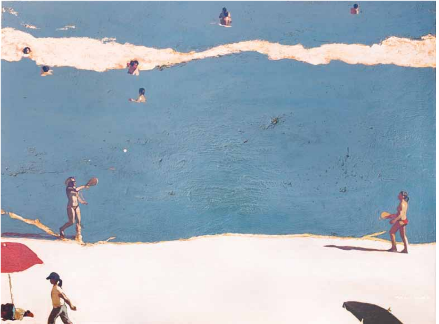
Mar blau - 97x130 cm - HST