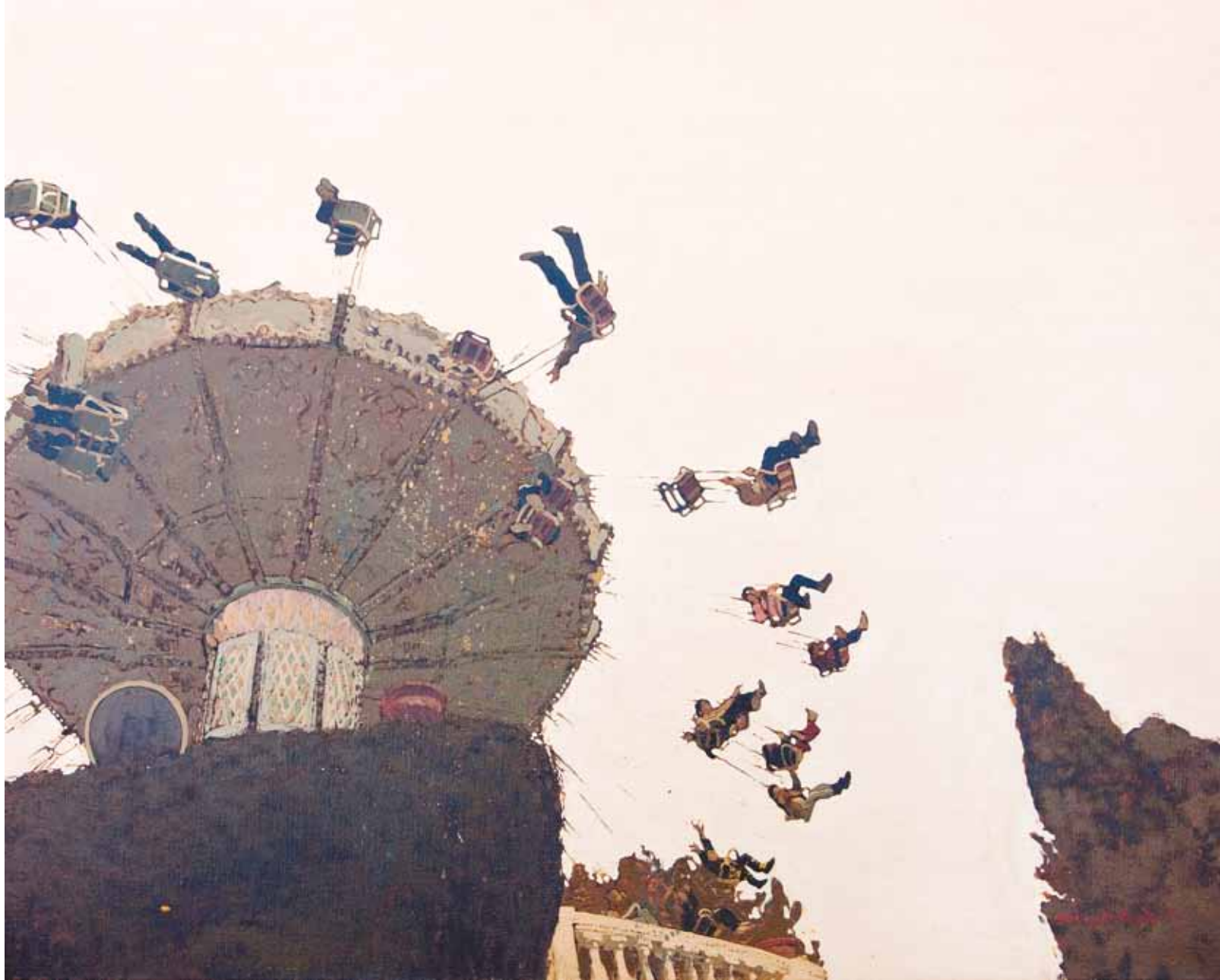
Beautiful day - 81x100 cm - HST