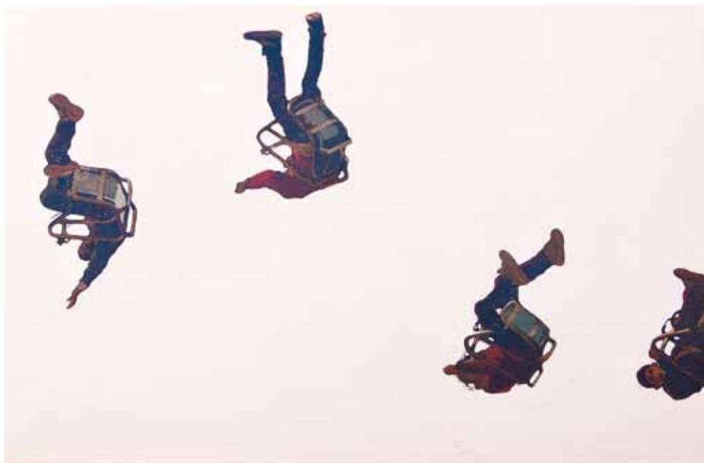
Coreografia - 65x100 cm - HST