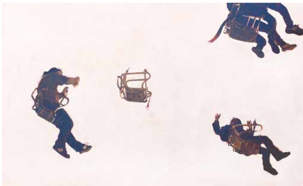
In the sky - 89x146 cm - HST