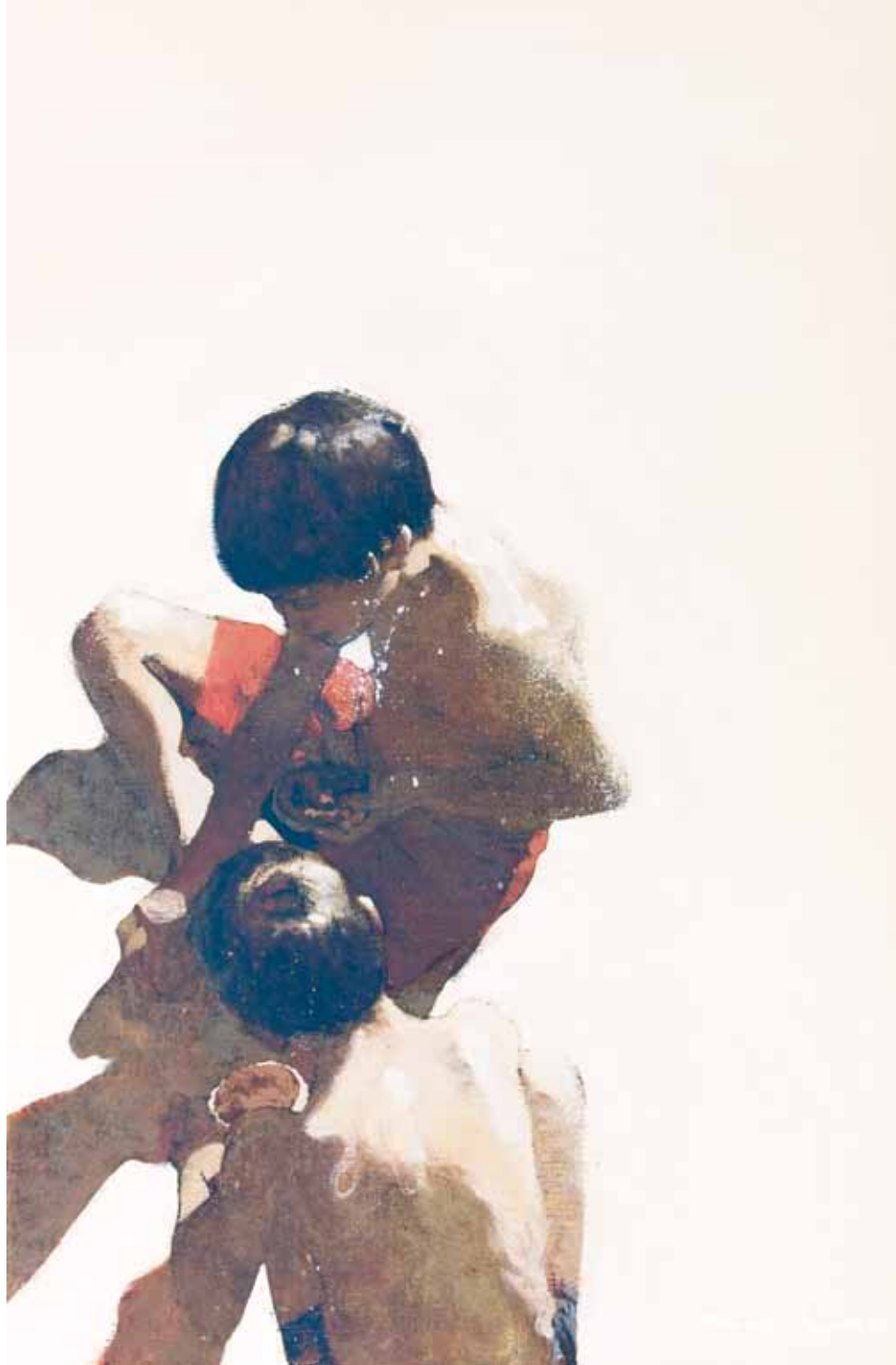
Els menjadors de magdalenes - 60x92 cm - HST