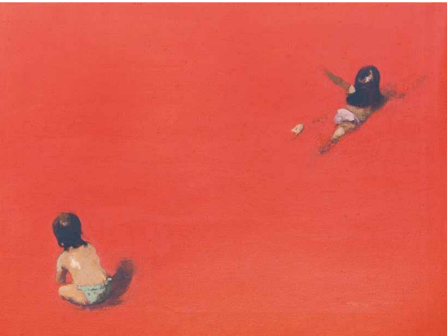
Strawberry swing - 60x81 cm - HST