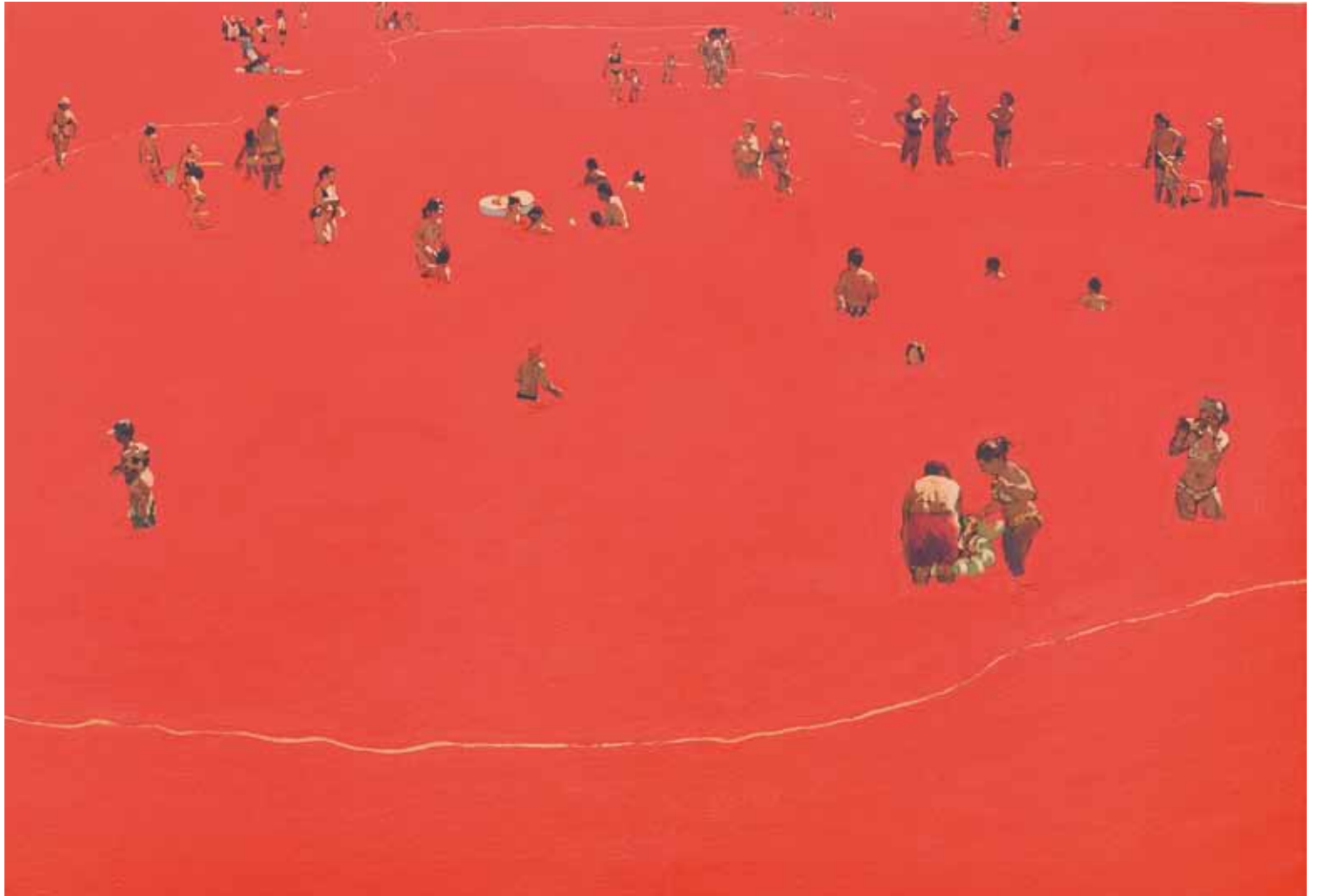
Càniques Guzman - 89x130 cm - HST