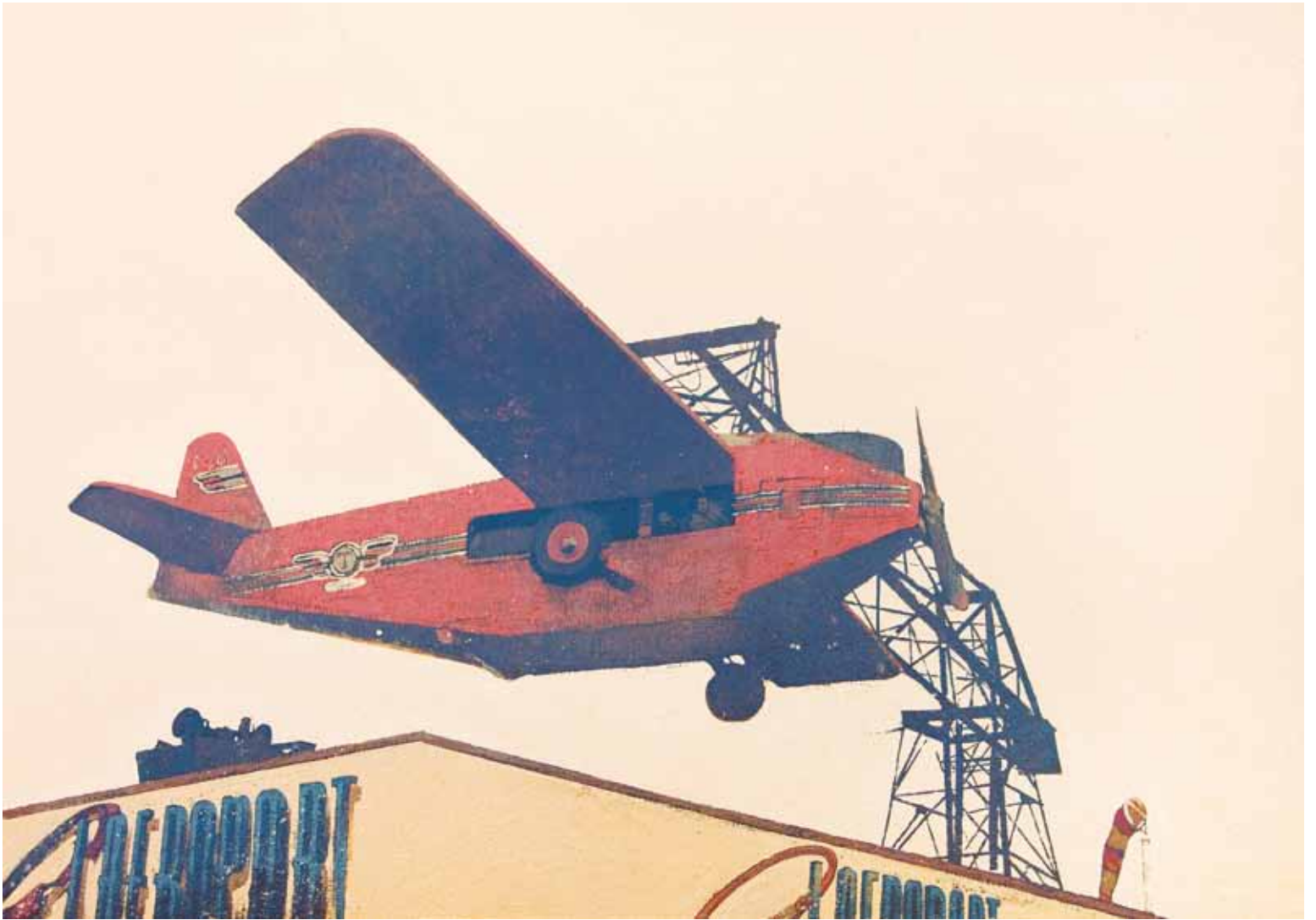
L' aeroport - 65x92 cm - HST