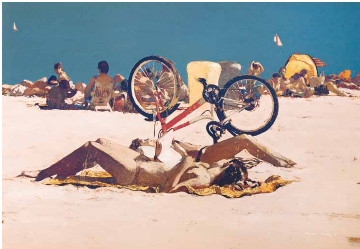
La bicicletta senza ombra - 162x114 cm - HST