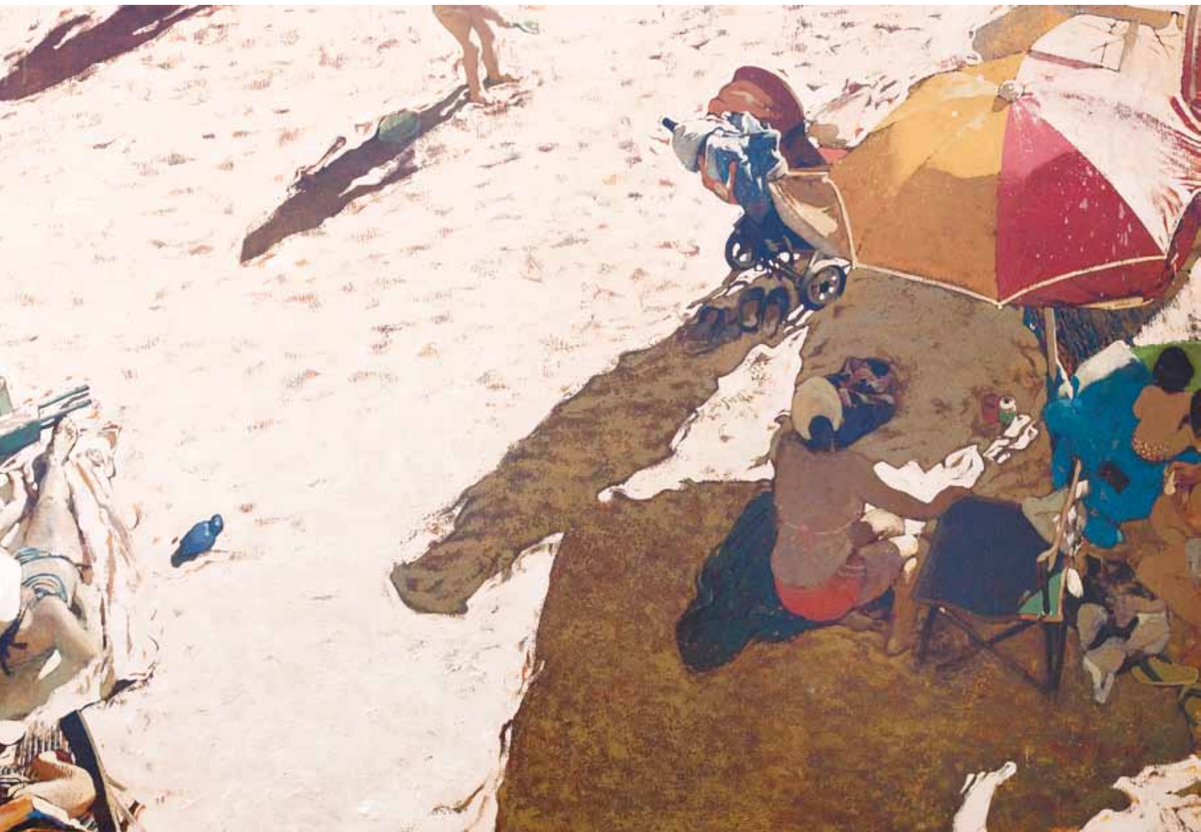
La tortuga blava - 100x146 cm - HST