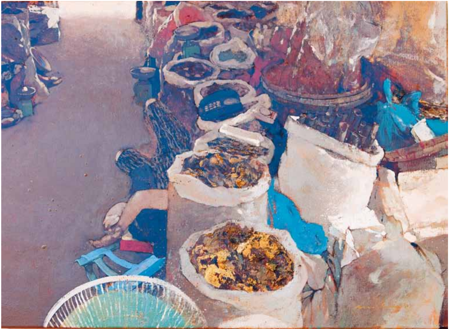
24 hores - 65x89 cm - HST